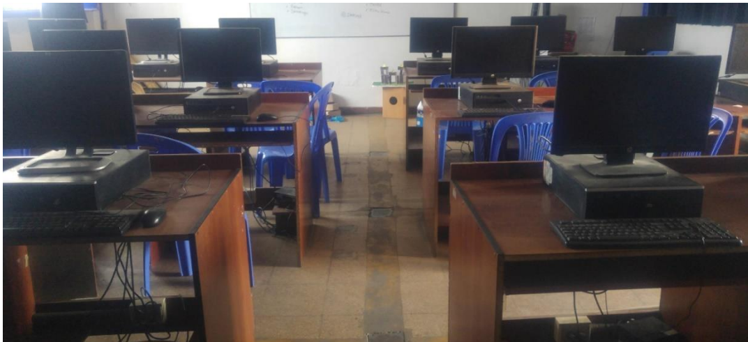
Figura 03. Sala de Cómputo