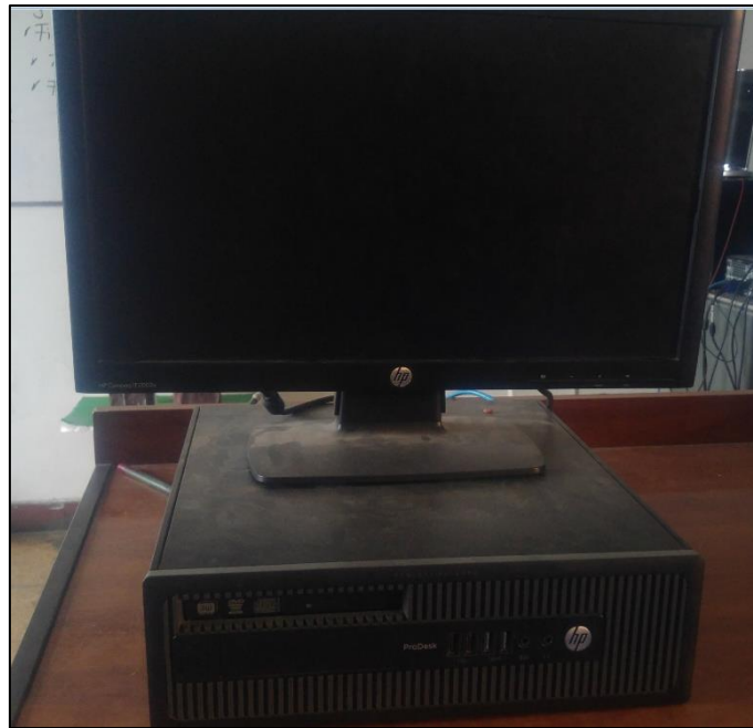
Figura 02. Máquina Operativa